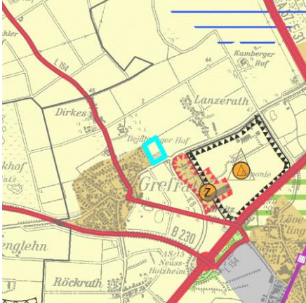
Fläche NE_Neu_04 (Grefrath, Lanzerather Busch)