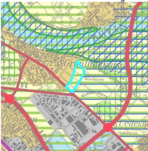
Fläche NE_Neu_05 (Grimlinghausen) – Erste Beteiligung, Rund 12,4 ha

Die Fläche wurde um 2,4 auf 10 ha verkleinert (Südzipfel) um die Abgrenzung vom Gewerbegebiet zu betonen. Diese auf Ebene der Regionalplanung vergleichsweise marginale Änderung begründet keine Bedenken und erfordert gleichfalls keine neue Stellungnahme.